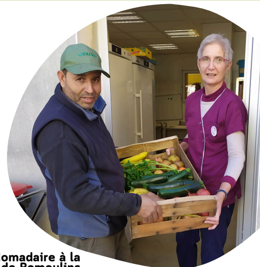
Livraison hebdomadaire à la crèche de Remoulins

Les achats ne sont pas encore du 100% de saison (les maraîchers leur revendent certains produits pour compléter les leurs et s'adapter à leur demande), mais cela ne saurait tarder, la CCPG réfléchit à des ateliers de cuisine pour décliner sous différentes formes les légumes et fruits de saison. Cela permettra de diversifier l'alimentation des tout-petits en leur proposant de découvrir de nouveaux goûts, de nouvelles textures, et de nouvelles saveurs.