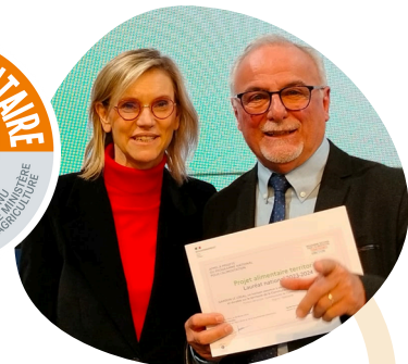
Remise de prix au Salon de l'Agriculture

Comme nous le faisons depuis un an et demi, nous pourrions continuer à mener des actions sur le territoire avec pour objectif de mieux manger et mieux produire. Bien qu'émergent, notre PAT a mené beaucoup d'actions concrètes depuis le début du projet. Rien de tel que le concret pour s'immerger dans le territoire et espérer tendre dès maintenant vers un accès pour tous à une alimentation locale, saine et de qualité.